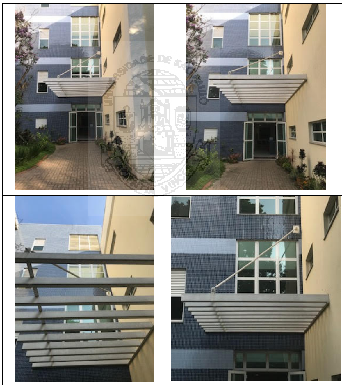
IMAGEM DA ENTRADA DO PRÉDIO DA ADMINISTRAÇÃO (LOCAL DE INSTALAÇÃO)